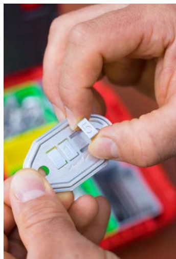
2. Schritt: Die Nummerneinsätze mit vorgeprägter Nummerierung werden aufgesteckt.