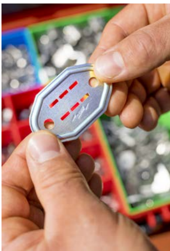
1. Schritt: Das vorgelochte Nummernschild wird entnommen.

Eine gut sichtbare und witterungsbeständige Nummerierung erleichtert die spätere regelmäßige Überprüfung und Wartung der Blitzschutz- und Erdungsanlage entsprechend den normativen Forderungen nach DIN EN 62305-3 1) . Die dauerhafte Dokumentation der Blitzschutz- und Erdungsanlage nach DIN 18014 2) sowie DIN EN 62305-3 Beiblatt 3 wird unterstützt.